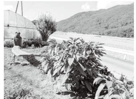
熊のベンチと咲き誇るエンゼル トランペット (9月)

く、心安らかに春や秋の観光シーズンを楽しめるのは？安らかなもいけれど、稲作の専業農家に生まれ育った私には明治生まれの祖父の「先祖様から引き継いだ土地を守り引き継ぐ」という、今では化石のような精神が叩き込まれていて、息子たちに口には出さずとも、何とかその気持ち伝わるよう農作業に励む毎日です。