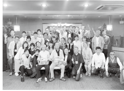
真田中学同期卒業生の会、前列に二2名の恩師を囲む42名(2025年10月)

また、全国的な中学部活の地域移行では、市は令和9年度からスタートし、真田地域のNP0さなだスポーツクラブは地域の指導者皆様との関わりも深く、中学の近くに公共施設も集中している絶好の環境であることから、比較的順調に進んでいると聞いています。小回りの利く地域で、子ども達を大切に想うよき真田地域ですね。 最後に、皆様におかれましては、健康にはご留意され、健やかな毎日である事をお祈りしています。また来年お会いできることを楽しみにしています。 (注)信濃毎日新聞2025年6月18日(水)及び8月20日(水)、地域11面東信版 【原稿】依頼2025年9月17日、入稿11月1日