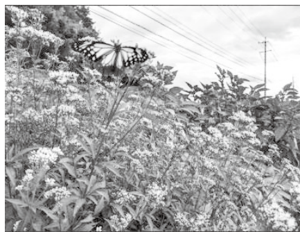
畑のフジバカマの蜜を吸う アサギマダラ (10月)