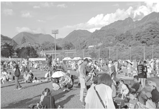
第41回真田まつり風景

今年、上田市誕生20周年を記念し、第41回真田まつり・真田三代花火大会が8月2日(土)、真