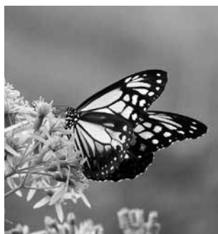
鳥帽子への道脇に羽を休めるアサギマダラ