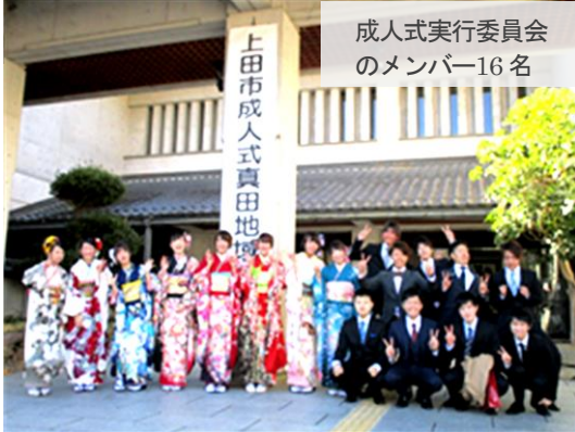
成人式実行委員会のメンバー16名